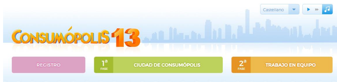
Ilustración 2. Captura de pantalla de la selección de los diferentes idiomas que tiene la plataforma.

La página de la ciudad de Consumópolis se abre en la lengua que ha elegido previamente en el portal. Si no se ha seleccionado ningún idioma, por defecto, se abre en castellano. En el caso de que quiera cambiar el idioma en la ciudad de Consumópolis , también puede hacerlo haciendo clic en el desplegable.