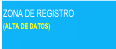
Ilustración 4. Imagen de la Zona de Registro

Para participar en Consumópolis es necesario que el personal docente coordinador registre a los equipos participantes. Cada equipo estará compuesto por cinco alumnos o alumnas matriculados en cursos de un mismo nivel de participación y estará coordinado por una persona docente del centro educativo (ver Base Segunda de las Bases reguladoras del Concurso escolar Consumópolis14).