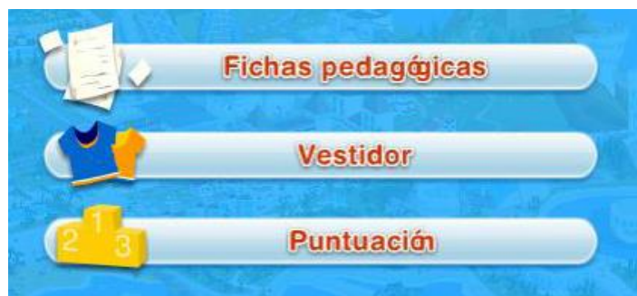
Ilustración 6. Captura de pantalla de las herramientas de las que dispone la persona usuaria

Para facilitar el desarrollo del concurso, las personas participantes disponen de las siguientes herramientas: